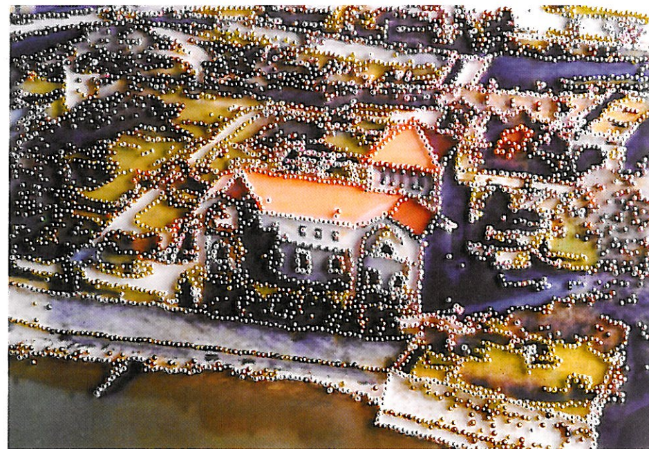
A vizek városa

SZERBTEMPLOM (Balassagyarmat, Szerb utca 5.) 2010. február 5-től március 25-ig